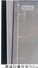
原液計量目安ライン