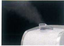
霧が長く飛ぶ吹出口

電源ONですぐに霧が発生し、効率よく次亜塩素酸水を放出、室内の除菌・消臭ができます。また噴霧する霧は熱くないのでお子様やお年寄りがうっかり触ってしまってもヤケドの心配がなく、どなたにも安心してお使いいただけます。