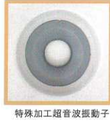
特殊加工超音波振動子

霧を発生させる心臓部の超音波振動子をはじめ、各部品は耐塩素仕様のものを採用しました。これにより従来機種に比べ約5~10倍の耐久性を実現しました。(当社比)