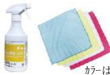
カラーは選べません