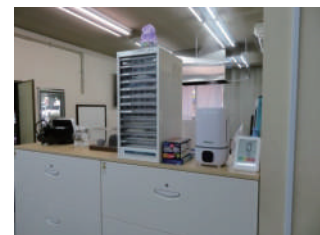
(株)中恒様オフィス空間噴霧の様子

いただいています。オフィスで噴霧するようになってから、毎年のようにインフルエンザに罹っていた社員の方が風邪さえもひかなくなっただけでなく、大変気に入ってくださっています。そして、この効果を広めたいと、ウィキルの紹介もしてくださっています。また、オフィスの噴霧の他に、近隣に飲食店が多い土地柄ならではの独特な使用方法なども教えてくださいました。