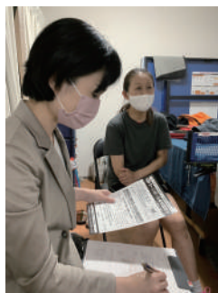
ONE PIECE 様取材の様子

株式会社万立では、ウィキルの使用について取材にご協力いただける施設様を募集しております。導入事例のページでウィキルの魅力をお伝えし、ご担当者様へ是非お声がけください！お待ちしております。