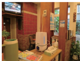
精養軒様店内空間噴霧の様子

一方、こちらの商店街にございます、人気の老舗中華料理店「精養軒」様では、基本的な感染対策は行なわれていますが、お客様にもっと安心して来店していただけるようにと、ウィキルの空間噴霧を始められました。噴霧器から出るミストは視覚的にも感染対策をしているということがわかりやすく、大変気に入ってくださっているようです。