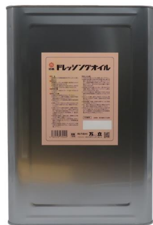
白馬ドレッシングオイル メーカー希望小売価格 40,260円(税込)

※オイルモップが乾燥してきたら、白馬ドレッシングオイルをスプレーで吹き付け、糸に染み込ませてから使用してください。 （目安：90cmの体育館モップ1枚当たり約10ml）