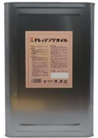
白馬ドレッシングオイル メーカー希望小売価格 40,260円(税込)

※オイルモップが乾燥してきたら、白馬ドレッシングオイルをスプレーで吹き付け、糸に染み込ませてから使用してください。 （目安：90cmの体育館モップ1枚当たり約10ml）